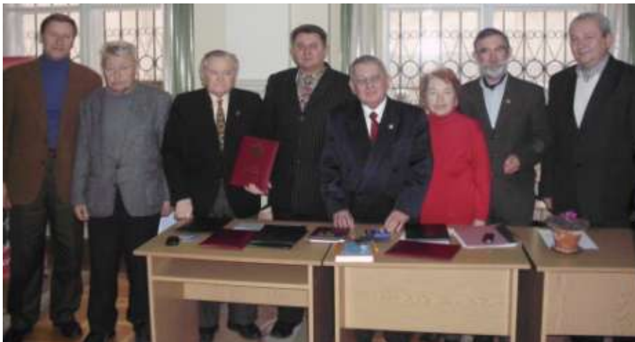
Українознавець – наш журнал!