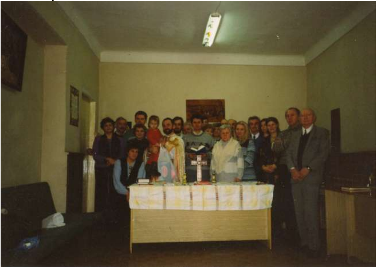
Українська греко-католицька громада м. Москви - шанувальник журналу «Українознавець»!