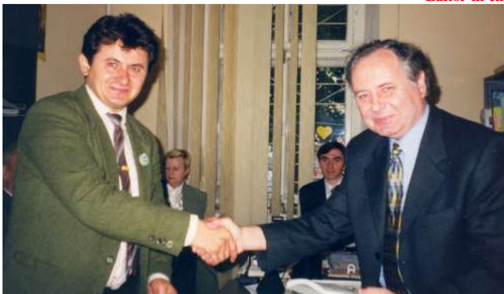
Ректор Українського Університету м.Москви, професор Університету «Львівський Ставропігійон».

Головний редактор – Віктор Ідзьо Editor-in-chief – Viktor Idzio