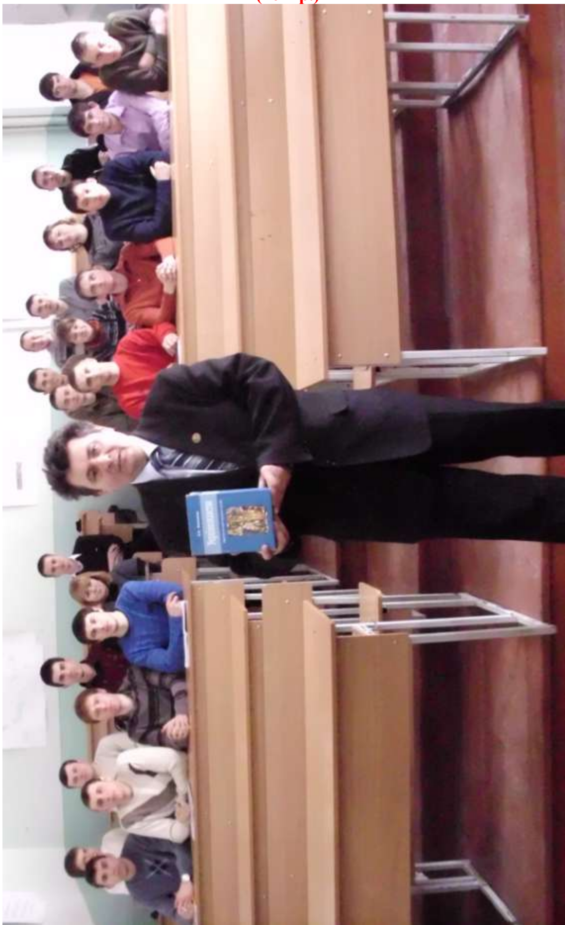
Академік Віктор Ідзьо серед студентів освітньо кваліфікаційного рівня “магістр”, авторів наукових праць з лекційного курсу «Українознавство». (2011р.)